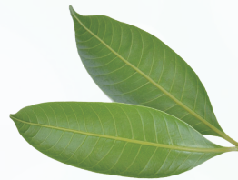
マンゴーの乾燥葉