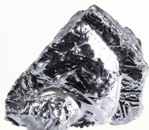
有機ゲルマニウム(Ge)